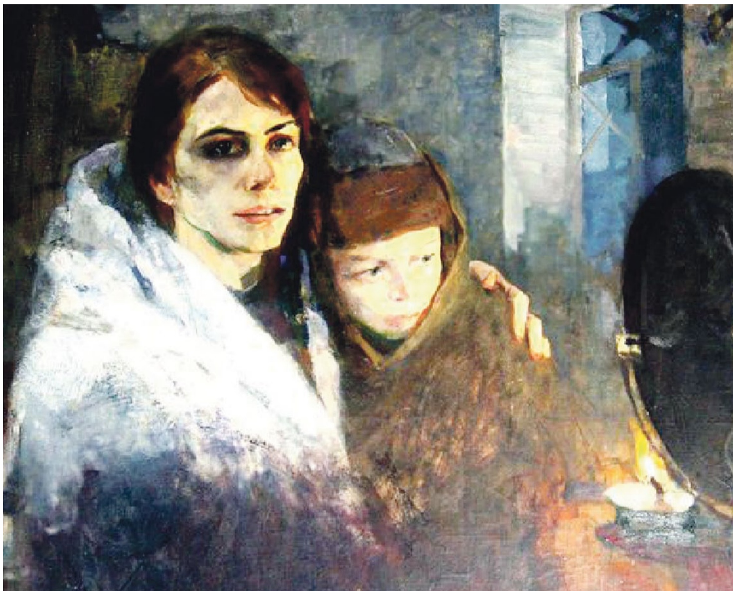
Мать Блоада. Художник К.И. Рудаков, 1942 г.