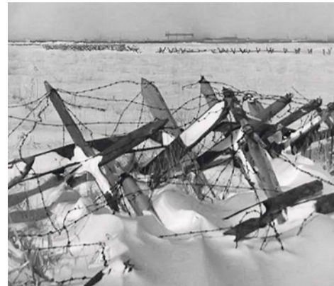
Линия заграждений на окраине Ленинграда, 1943 г.

Подождала, прижала к себе и сказала: «Что же это ты, сыночек, уходишь и не говоришь куда?» Посмотрев на рюкзачок с продуктами, сказала чуть слышно: «Не ходи, сыночек, больше на передовую». Наверное, ей обо всем рассказали соседи. Мама терла мои замерзшие щеки, нос, дышала на руки. Я молчал, мне было радостно и стыдно. И вдруг я куда-то провалился, заснул крепким сном у мамы на руках.