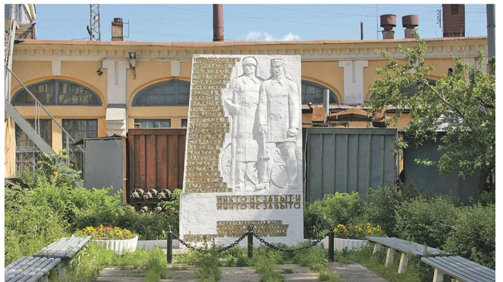
Памятная стела на Московской Сортировочной станции