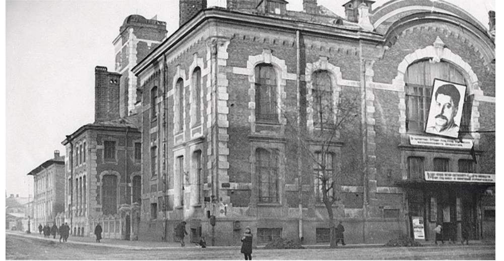
Дом культуры железнодорожников на Тамбовской улице, начало 1950-х годов

Те, кому удалось втиснуть кастрюлю в жерло, старались как-нибудь зачерпнуть драгоценной влаги и вытащить ее наверх. Я тоже принял участие в этом представлении – со стороны все выглядело довольно смешно.