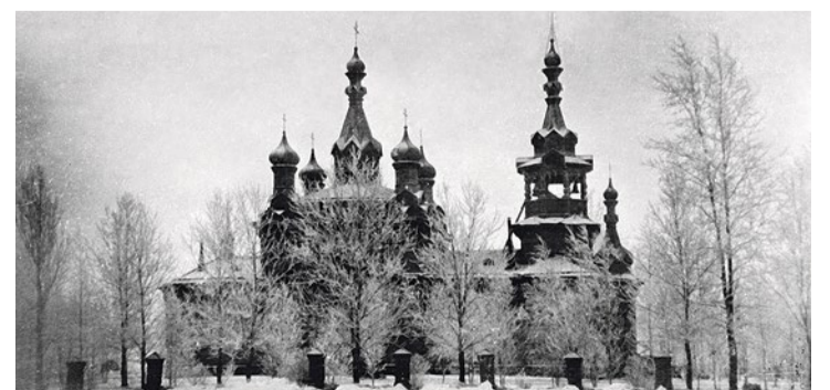
Церковь во имя преподобного Герасима, 1927–1930 гг.