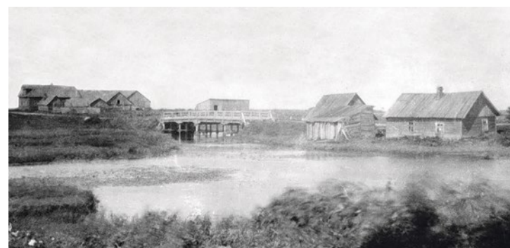
Мост и кузница в деревне Купчино, 1927–1930 гг., из альбома «Старое Купчино»

Запись Д. В. Шаляпина, 2014 г. В обработке О. А. Ясененко, 2021 г.