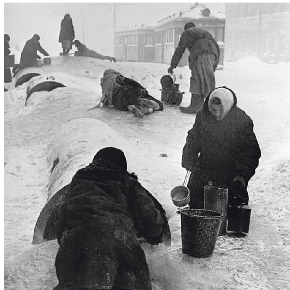
Ленинградцы черпают воду из лопнувших труб на Звенигородской улице, январь 1942 г.

Мы с женой пошли на Камчатскую за водой. На санки поставили кастрюли и двинулись. На Камчатской был колодец 1 . Верхнее строение его было сломано на топливо, и осталось лишь жерло, покрытое наледью. Наледь напоминала вулкан, в середине которого виднелось жерло колодца. И вот по этой наледи лезли люди с кастрюлями и старались впихнуть их в жерло. Они ползли, скользили вниз, снова ползли.