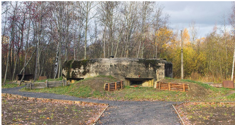
Дот № 204 рубежа «Ижора»