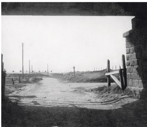
Южное шоссе у платформы Сортировочная, 1938 г.