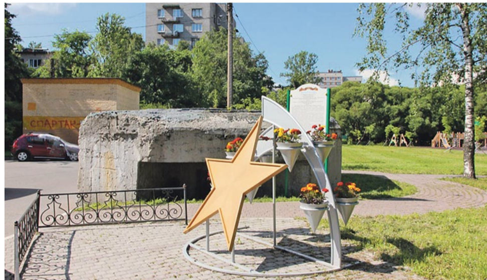
Дот № 20 рубежа «Ижора», фото Д.В. Шаляпина

Источник: Карасев Г.П. Мои воспоминания // Муниципальное обозрение. 2001. № 5 (Апр.). С. 3. В обработке О.А. Ясененко, 2021 г.