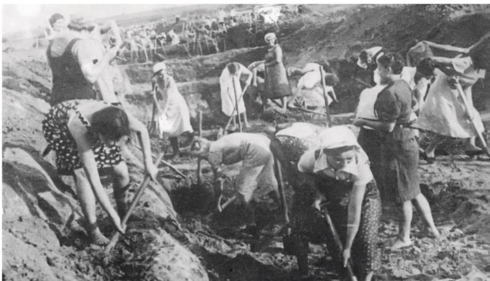
Жительницы Ленинграда роют противотанковый ров. Июль 1941 г.

По земле современного Купчина в годы войны было проложено три противотанковых рва. Самый ближний к Ленинграду находился в районе улицы Салова. Следующий ров был вырыт южнее Куракиной дороги (ныне – Южное шоссе и Альпийский переулок), его строительство описывает К. Е. Школьников. Небольшой фрагмент этого рва сохранился у перекрестка улиц Димитрова и Софийской. Третий противотанковый ров был построен вдоль Южной окружной железной дороги, чуть севернее Малой Балканской улицы.