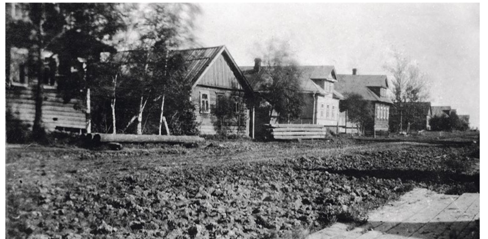
Главная улица в деревне Купчино, 1927–1930 гг., из альбома «Старое Купчино»

Запись Д. В. Шаляпина, 2011 г. В обработке О. А. Ясененко, 2021 г.