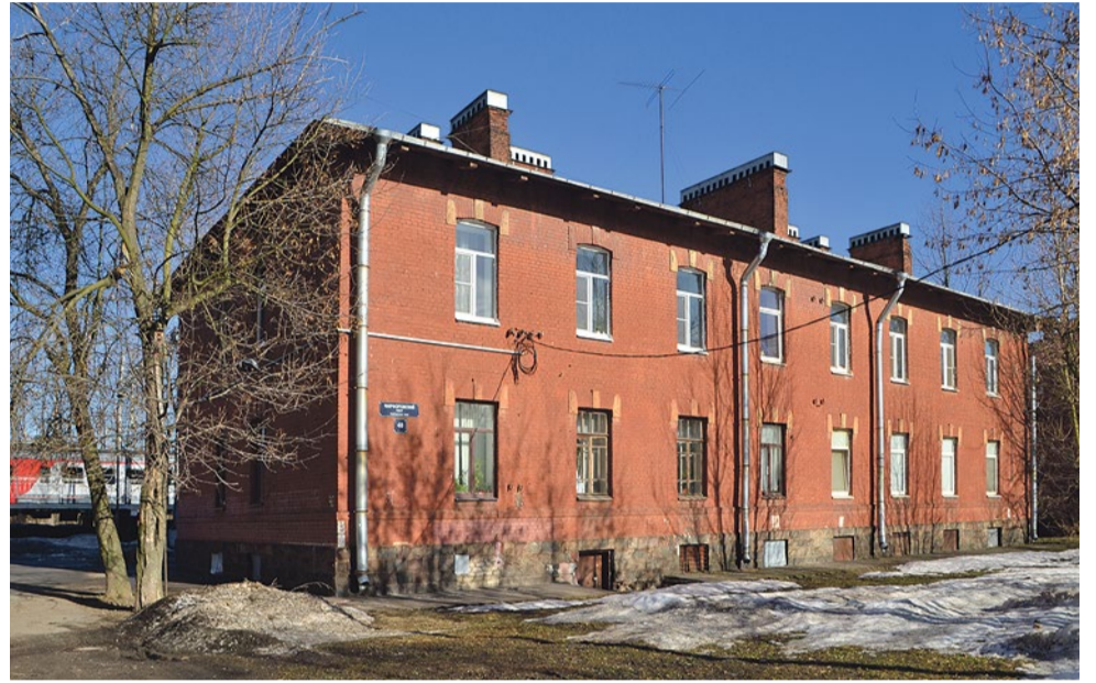
Дом № 40 на Фарфоровском посту