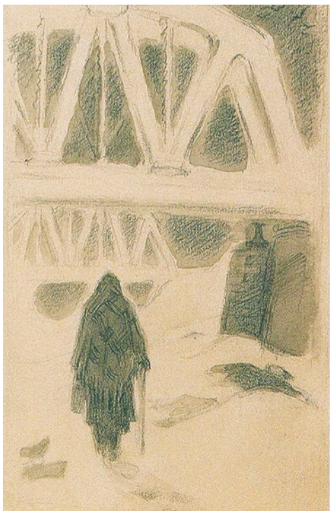
Дорога под семью мостами. Художник Л.А. Рончевская, 1941 г.

Восемь лет в семье не было детей, а когда бабушка забеременела, началась война. Осенью 1941 года в 34-й дом попала бомба. Наша комната уцелела, но была угроза обрушения здания. Всех жильцов переселили, и бабушке досталась комната в подвале соседнего дома № 40. Подвал был высоким, с двухметровыми потолками. Его разделили на комнатки, и в каждой поставили печь. Так жило много семей.